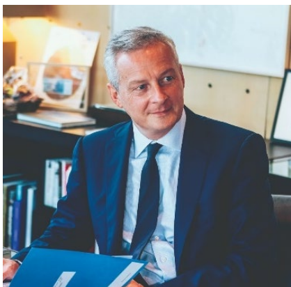
Bruno Le Maire, ministre de l'Économie, des Finances et de la Relance.

Les entreprises et leurs salariés sont le cœur battant de l'économie française. La décision de les protéger « quoi qu'il en coûte » était le seul choix responsable.