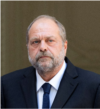
Éric Dupond-Moretti , garde des Sceaux, ministre de la Justice.

En cette période de sortie de crise, où l'Etat continue plus que jamais d'être aux côtés de nos entreprises, je suis convaincu que la justice a un rôle majeur à jouer pour soutenir toutes celles et ceux qui, individuellement ou collectivement, font au quotidien notre économie et contribuent à sa croissance.