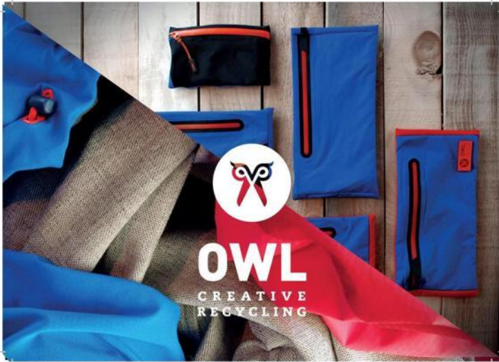
Recyclage des vestes techniques