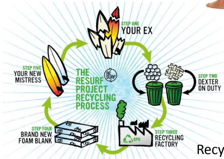
Recyclage des planches de surf