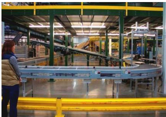
Tests Supply Chain