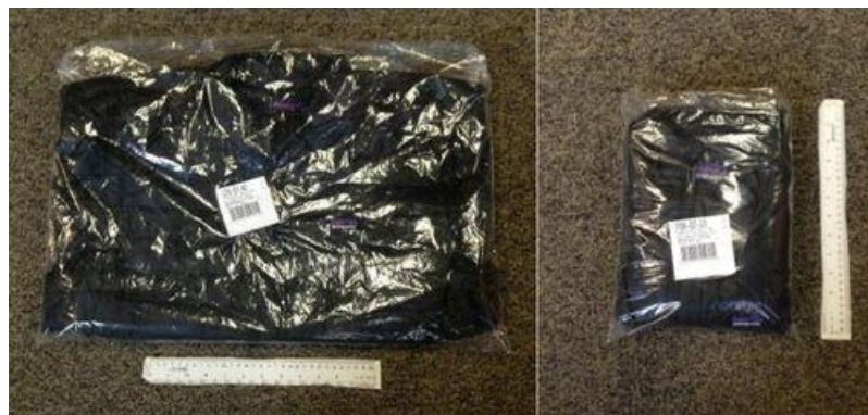
Re Design & Epaisseur (-50%)