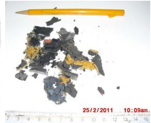
Recyclage des combinaisons