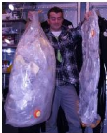
Tests Compaction Magasins